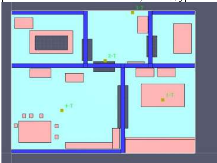
Рис. 1 Расположение температурных датчиков

Основным материалом пожарной нагрузки является сосна. Общая ее масса в помещении составила 18700 кг, сюда вошли как стены и пол, так и различные препятствия, находящиеся в помещении. Результаты моделирования фиксируются четырьмя датчиками (рис. 1), расположенными на высоте 1,7 м над уровнем пола.